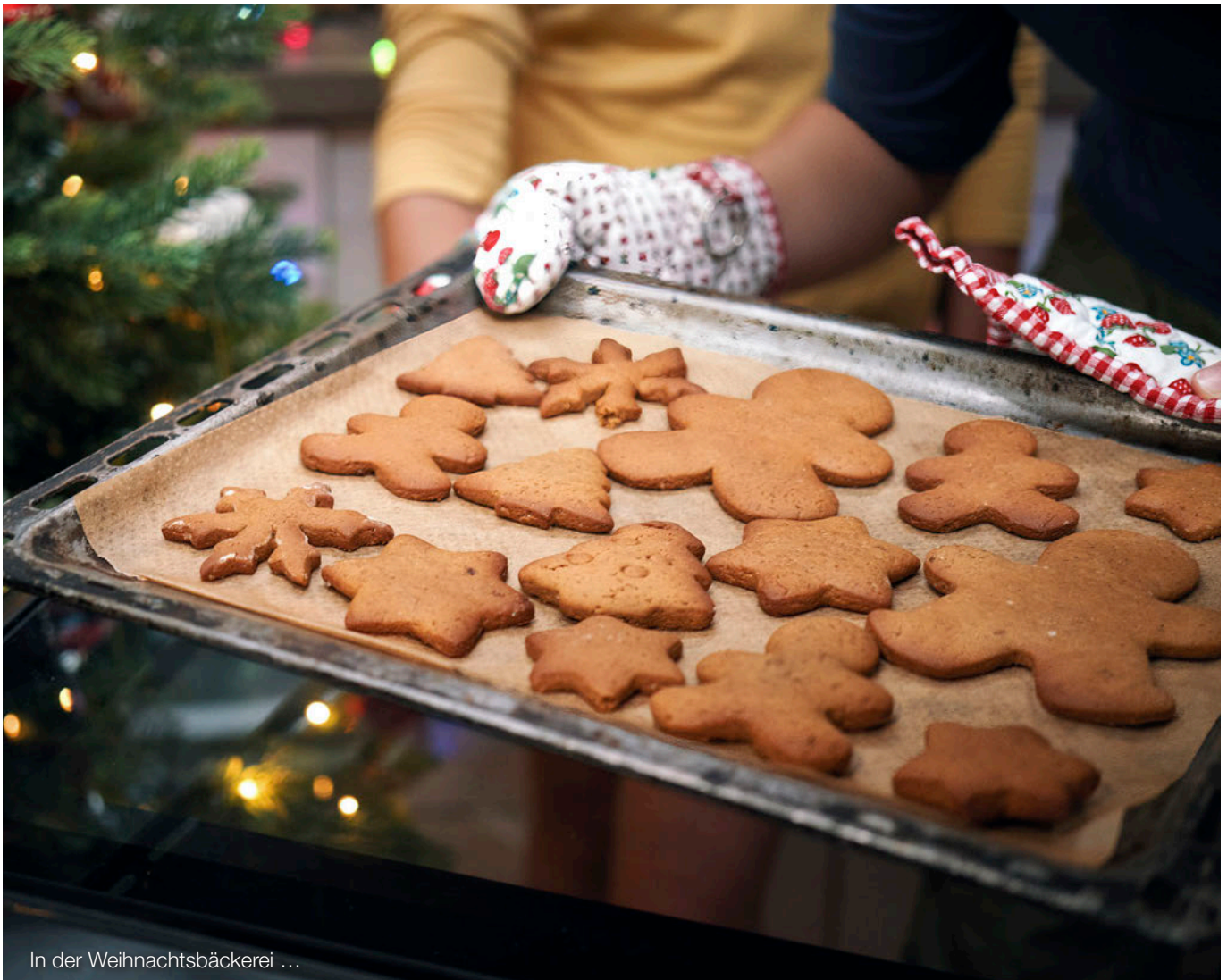
In der Weihnachtsbäckerei ...

ausgetauscht werden, die in Relation zum gesamten Sachanlagevermögensgegenstand wesentlich sind (vgl. dazu die Hinweise des Instituts der Wirtschaftsprüfer in Deutschland e.V. (IDW) in der Stellungnahme HFA RH 1.016). Unter Komponentenansatz ist dabei eine Methode zu verstehen, bei der ein Vermögensgegenstand gedanklich in seine wesentlichen Komponenten unterschiedlicher wirtschaftlicher Nutzungsdauern zerlegt wird, um den Betrag der planmäßigen Periodenabschreibung des Vermögensgegenstands als Summe der auf seine einzelnen Komponenten entfallenden planmäßigen Periodenabschreibungen zu ermitteln. Als Beispiel wird hier vom IDW im Falle eines Gebäudes die separate Abschreibung des Daches (Nutzungsdauer 20 Jahre) und des restlichen Gebäudes (Nutzungsdauer 60 Jahre) genannt. Diese komponentenweise Abschreibung führt im Vergleich zur Ermittlung der planmäßigen Periodenabschreibung für den Gesamtvermögensgegenstand auf der Grundlage von dessen pauschaler Gesamtnutzungsdauer zu abweichenden Abschreibungsbeträgen und im Ergebnis zu einer verursachungsgerechteren Periodisierung des Aufwands aus der Nutzung des Vermögensgegenstands.