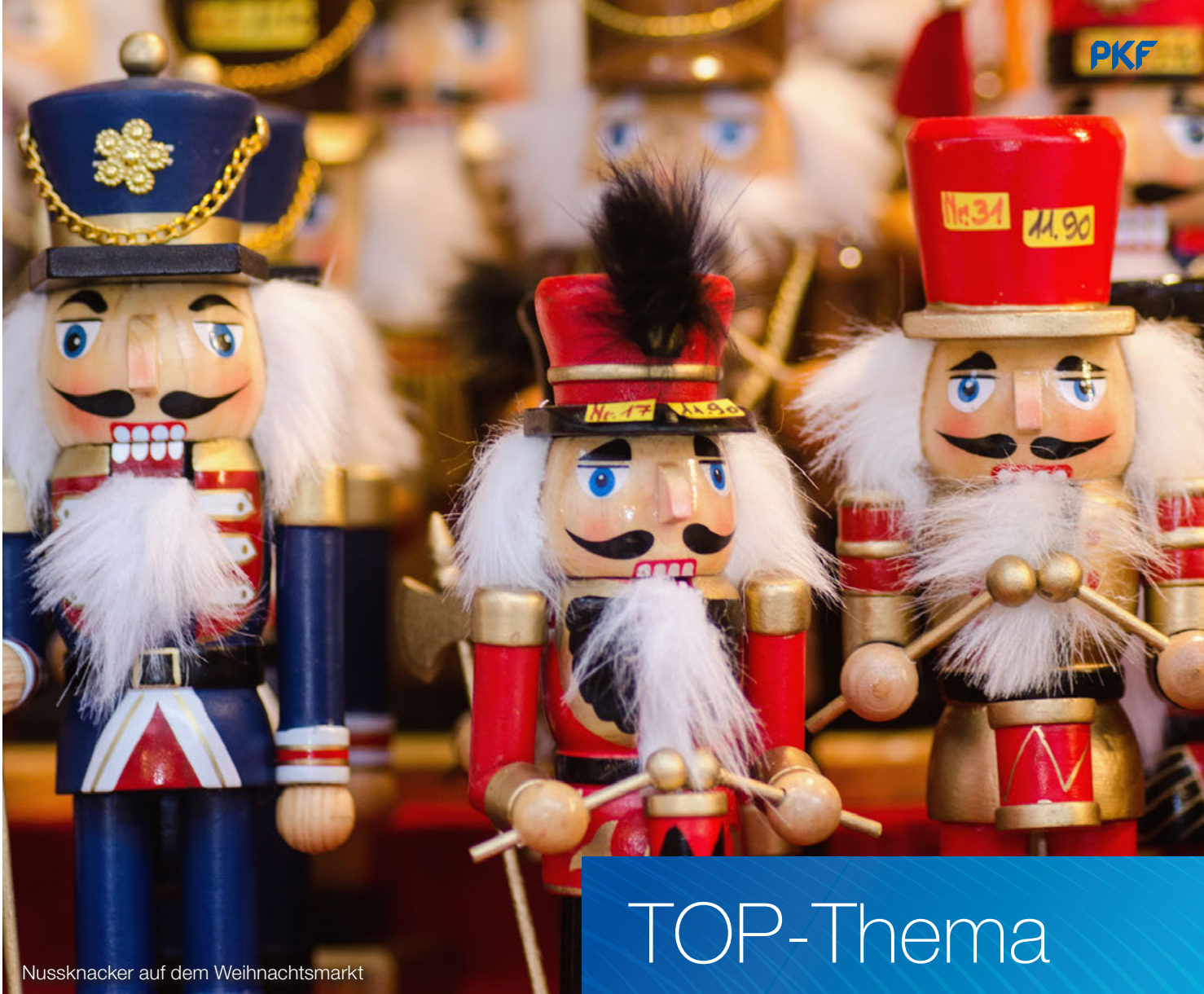
Nussknacker auf dem Weihnachtsmarkt