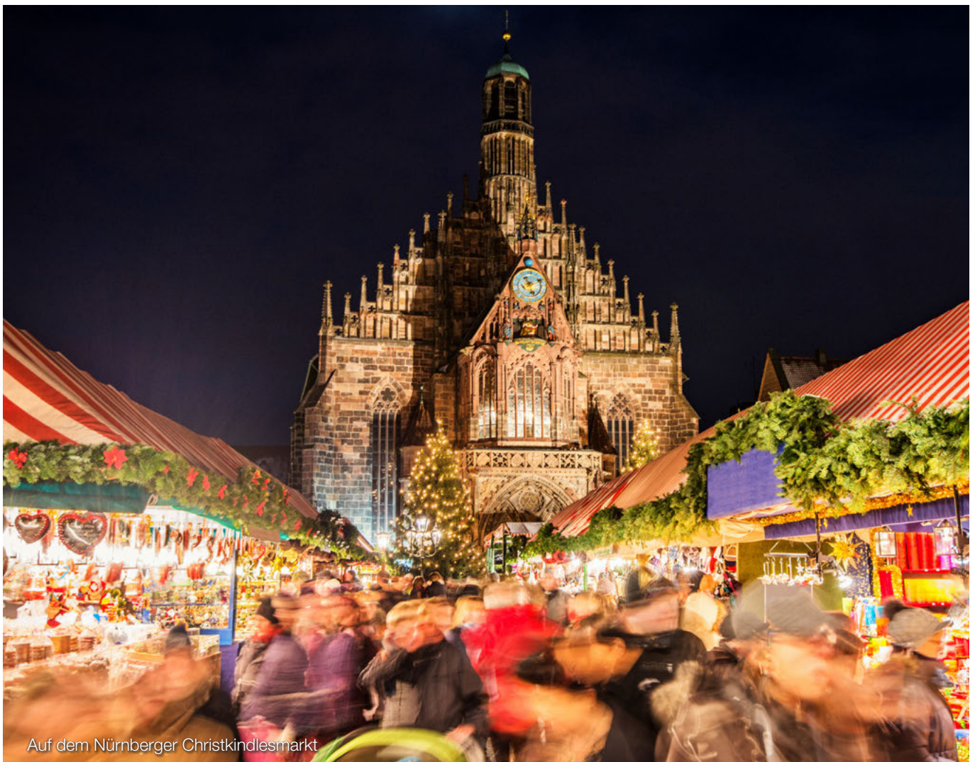
Auf dem Nürnberger Christkindlesmarkt

Die nationale Umsetzung der Richtlinie in das jeweilige Recht der EU-Mitgliedstaaten ist dabei sehr unterschiedlich, da die entsprechenden Parameter der Plastiksteuer von den Mitgliedstaaten individuell festgelegt werden können.