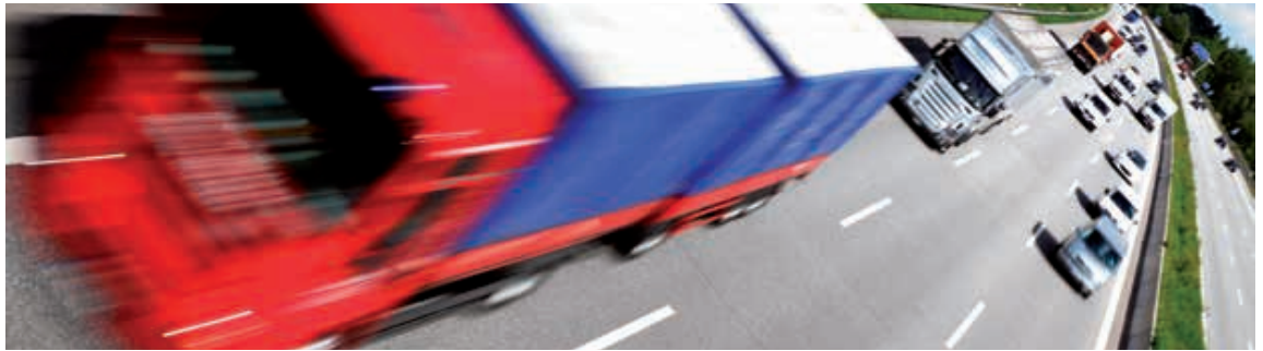
Mehr Rechtssicherheit bei der Zuordnung bewegter Lieferungen

Beschlossen wurde, dass die Verein-fachungsregelungen unabhängig davon gelten sollen, ob die Beteiligten zertifizierte Steuerpflichtige sind oder nicht.