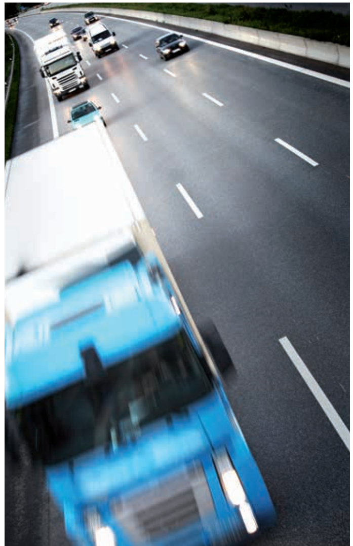
Neuer Rechtsrahmen für EU-Lieferungen